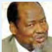
Ex-Presidente Joaquim Chissano

Os homossexuais constituíam um dos grupos perseguidos na Alemanha, durante o regime nazista. Os movimentos pelos direitos dos homossexuais duramente reprimidos pelo Partido Nazi.