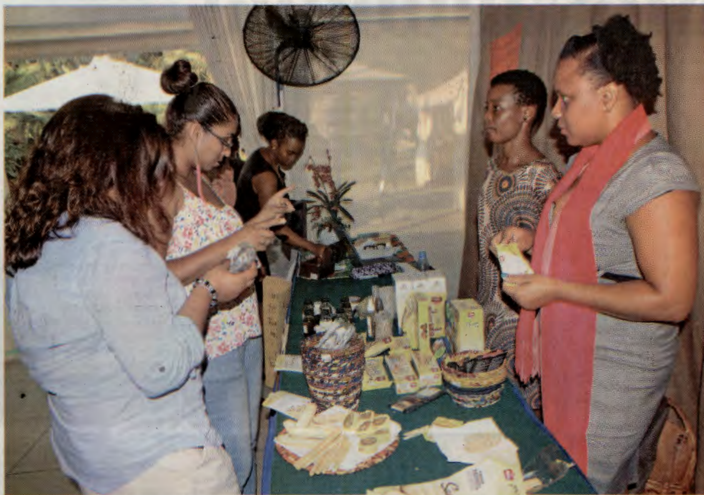
Pretende-se que a mulher contribua mais no desenvolvimento através da inovação

A INTEGRAÇÃO da mulher no mercado de trabalho, que começa com a formação técnico-profissional, continua um desafio a avaliar pela fraca presença desta na inovação, ciência, tecnologia e engenharias consideradas áreas proibitivas para ela.