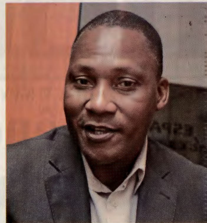
Apostamos nas mulheres que querem ser cientistas, Benjamin Langa

Para Langa, director nacional adjunto de Ciência e Tecnologia no Ministério da Ciência, Tecnologia, Ensino Superior e Técnico-Profissional (MCTESTP), o país atingiu avanços significativos na inclusão da mulher e participação nas áreas de ciência e inovação graças aos diferentes