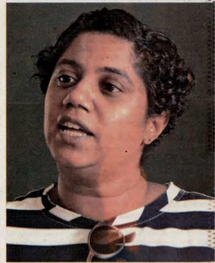
Já vi muitas mulheres a prosperar com ideias inovadoras

"Este é o caminho do empreendedorismo, porque não nos basta termos o conhecimento e a experiência, mas precisamos de capacidade para que o nosso conhecimento seja uma mais-valia para trazer estas soluções que o nosso mercado precisa", concluiu.